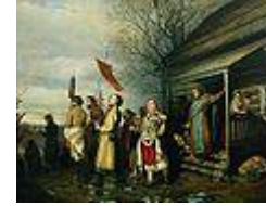
Сельский крестный ход на Пасхе ( 1861, В. Г. Перов )