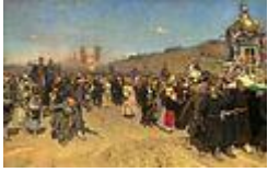
Крестный ход в Курской губернии (1883, И. Е. Репин)