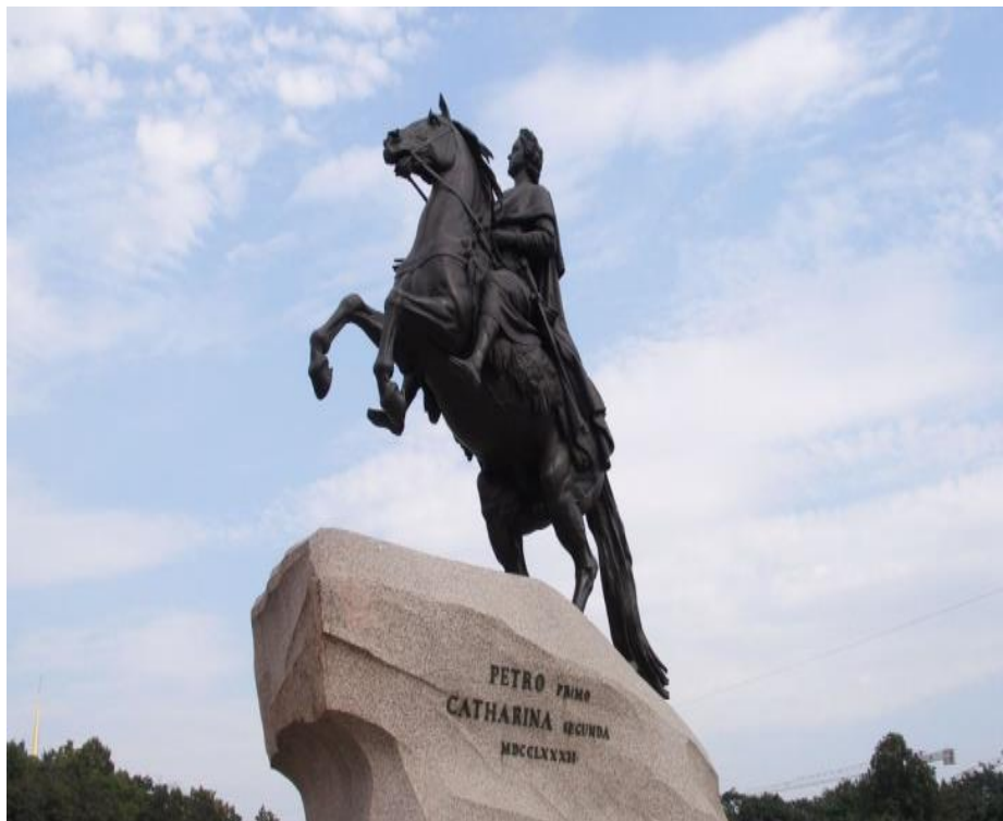
Памятник Петру I