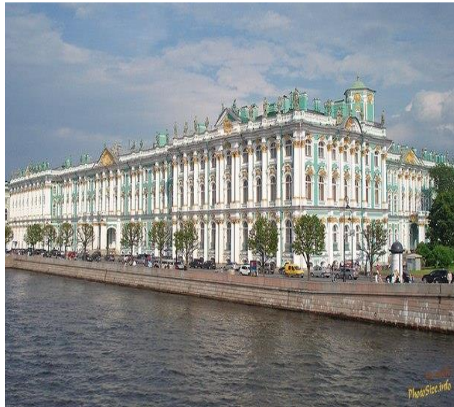
Зимний дворец (Эрмитаж)